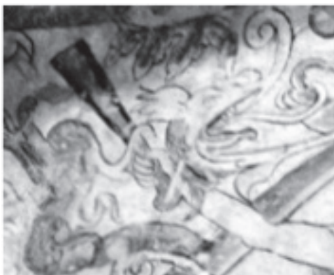
Ixmiquilpan, Hgo. Mural