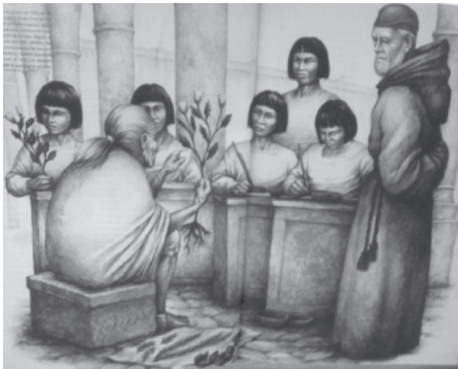
Ejercicio académico en Tlaltelolco escribiendo el Códice Cruz-Badiano (Bye, 2013 )

En este lugar los aliados ahora han de gobernar en condiciones de igualdad con los nuevos príncipes bautizados. Ambos proceden de cultura guerrera y se les propone la reducción a la paz ¿podríamos pensar en la proverbial mansedumbre del indígena resaltada por Mendieta, (Mendieta, 1980) como simple constatación de un temperamento local? ¿Existe acaso sed de una visión idealizada del “hombre nuevo” cristiano y del gobernante pacífico propuesta por Platón? 6