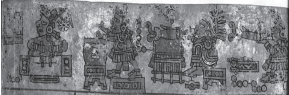
Figura 3. La música. Códice Becker, lámina 8.