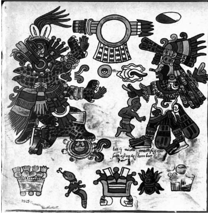
Figura 1. Tepeyolohtli conjurando junto con Quetzalcóatl . Códice Borbónico, lámina 3.

otros contextos. Este lenguaje figurado o código especial tuvo su máxima expresión en los discursos de tipo institucional, es decir, discursos que formaban parte de rituales sagrados o formales. 15