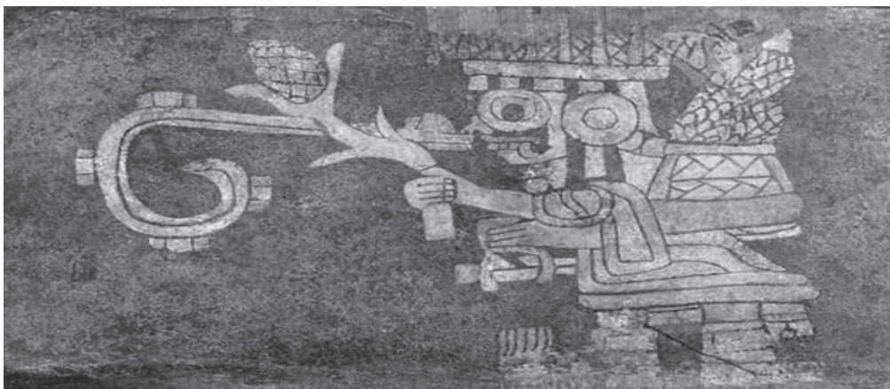
Figura 2. Colgando del brazo de Tláloc lleva un cesto con mazorcas en el ritual para la siembra del maíz. Pintura mural de Zacuala, Teotihuacan.