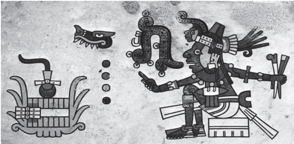
Figura 4. Lenguaje ritual, el conjuro o el nahuallahtolli . Códice Fejérváy-Mayer, lámina 14.

A este lenguaje especial, llamado nahuallahtolli , dan las fuentes calificativo de oscuro y secreto, inspirado por el demonio para acentuar su carácter esotérico, y el sentido etimológico de su nombre afirma esta naturaleza, aunque aparte de que puede traducirse como lenguaje encubierto, significa lenguaje de los brujos o lenguaje mágico. 23