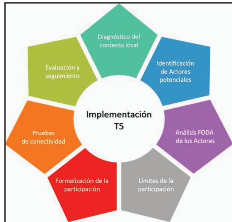
Ilustración 3. Proceso de implementación de Tārah 5.

Por esas razones se ha pensado en la conveniencia de que el modelo Tārah 5 sea propuesto por un organismo internacional o regional con suficiente autoridad moral e imparcialidad, como ONU Mujeres, Igualdad de género y desarrollo (Banco Mundial) y la Comisión Interamericana de Mujeres, entre otras. El trabajo de tal liderazgo sería el de preparar el terreno para la implementación del modelo Tārah 5 que podría lograrse en los siguientes pasos: