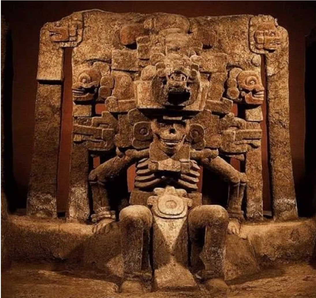
Figura tomada de: https://www.diariodexalapa.com.mx/local/-984026.html

“Ya puedo morirme en paz, conozco al dios del inframundo”.