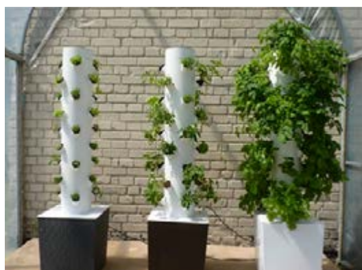
Imagen 2. Torres de Cultivo Aeropónicas.

A pesar de todas las maravillas que brinda la aeroponía, ésta sigue siendo un proyecto en desarrollo. Algunas de las complicaciones que se llegan a presentar son el alto costo de instalación inicial (el cual se recupera rápidamente después de unos meses), pérdidas significativas de producción (por un mal manejo del sistema), y posibilidad de infecciones (si no existe un protocolo de higiene adecuado). No obstante, se puede concluir que la aeroponía es una técnica de cultivo superior, que en un futuro podría ayudar a solucionar el problema de hambruna que abruma a la Tierra.